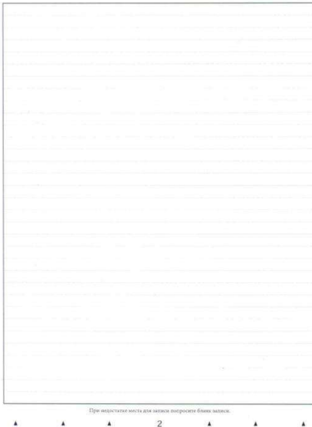
Рис. 6. Обратная сторона двустороннего бланка записи

4.4. В случае использования двустороннего бланка записи при недостатке места для оформления итогового сочинения (изложения) на лицевой стороне бланка записи участник может продолжить записи на оборотной стороне бланка (рис. 6), сделав внизу лицевой стороны запись «смотри на обороте».